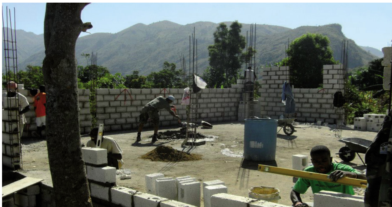
Personal del Batallón “Uruguay VI” construyendo conjuntamente con voluntarios efectivos del contingente hindú y la comunidad local.