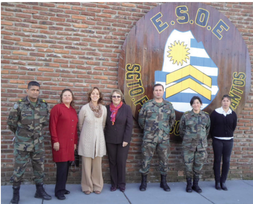
Dirección, profesores y alumnos, un equipo que supera todas las barreras.

Como concluyó el Cabo 1ª Claro, “se requiere mucho esfuerzo pero nada es imposible. Sólo hay que tener voluntad”.