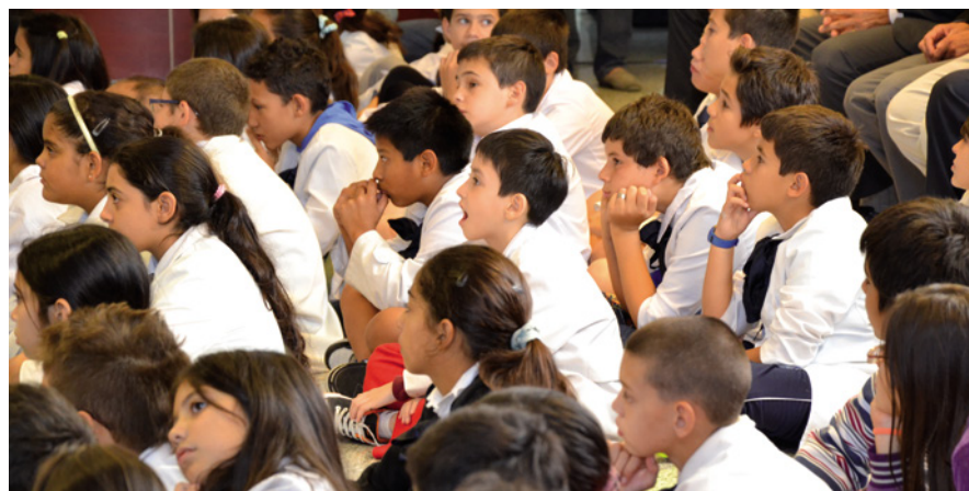
Alumnos de la Escuela Pública concurren al lanzamiento del Atlas Cartográfico.

Asimismo, se puede descargar el eBook Atlas Cartográfico del Uruguay en la web www.sgm.gub.uy