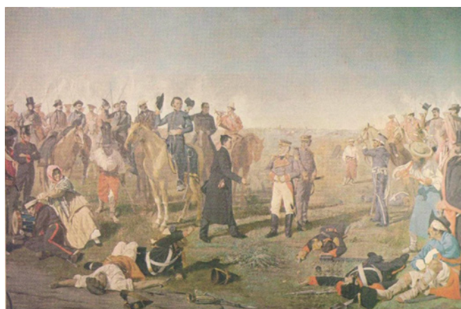
Óleo sobre tela “Batalla de Las Piedras”, de 5,02 m x 2,845 m, realizado por Juan Luis y Juan Manuel Blanes (hijo y padre).

Esta publicación es lanzada en el mes de mayo, mes en el que nuestra Fuerza festeja un nuevo aniversario de su creación el 18 de mayo de 1811 en la “Batalla de Las Piedras”. Hecho trascendental liderado por nuestro prócer el General don José Gervasio Artigas quien puso en práctica sus