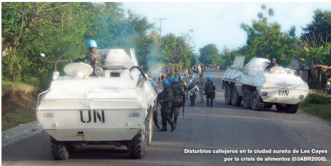
Disturbios callejeros en la ciudad sureña de Les Cayes por la crisis de alimentos (03ABR2008).

La labor de Naciones Unidas en Haití comenzó en febrero de 1990 cuando, a petición del Gobierno Provisional, el Grupo de Observadores de las Naciones Unidas para la Verificación de las Elecciones en Haití (ONUVEH) supervisó la organización y la celebración de elecciones en el país. La situación empeoró tras el Golpe de Estado de 1991 y el derrocamiento del Presidente legítimo.