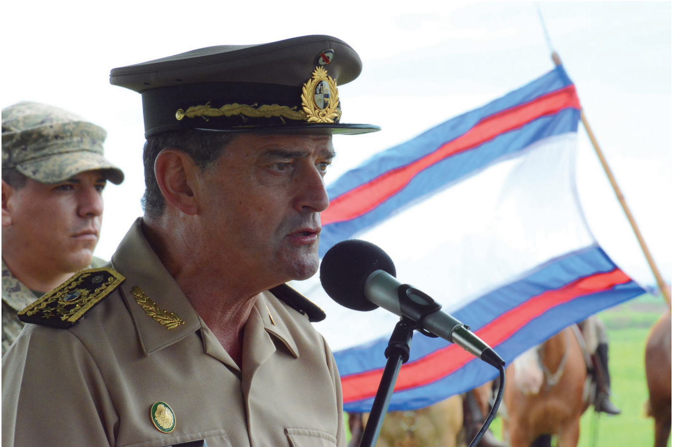
• Fotografía cortesía de la Intendencia Departamental de Artigas.

El pasado 4 de enero se conmemoró en los campos de Catalán, departamento de Artigas, el bicentenario de la batalla que significará una dura derrota para las fuerzas artiguistas, ante el invasor portugués.