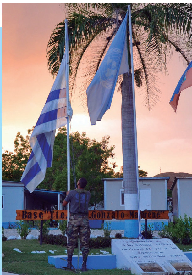
La Base Teniente Coronel Gonzalo Martirené, ubicada en el Departamento de Mirebalais, cerró sus puertas el 4 de febrero de 2015.

Actualmente, el contingente desplegado en Haití cuenta con 248 efectivos pertenecientes nuestro Ejército y 160 al Ejército de Perú.