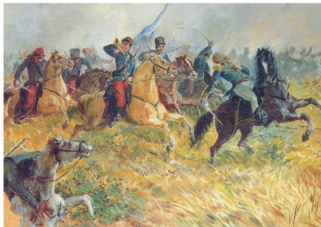
Cuadro “Muerte del Cnel. Brandsen durante la Batalla de Ituzaingó” de Augusto Ballerini.

Después de Ituzaingó el ejército brasileño se retira perseguido por el vencedor. En Camacú éste alcanza y le inflige nueva derrota el 23 de abril de 1827.