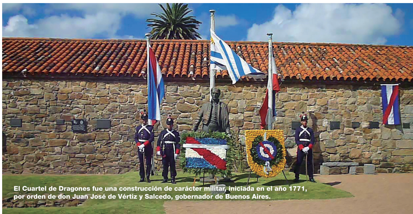
El Cuartel de Dragones fue una construcción de carácter militar, iniciada en el año 1771, por orden de don Juan José de Vértiz y Salcedo, gobernador de Buenos Aires.

Se prepara el que será el Prócer de los Orientales y Protector de los Pueblos Libres.