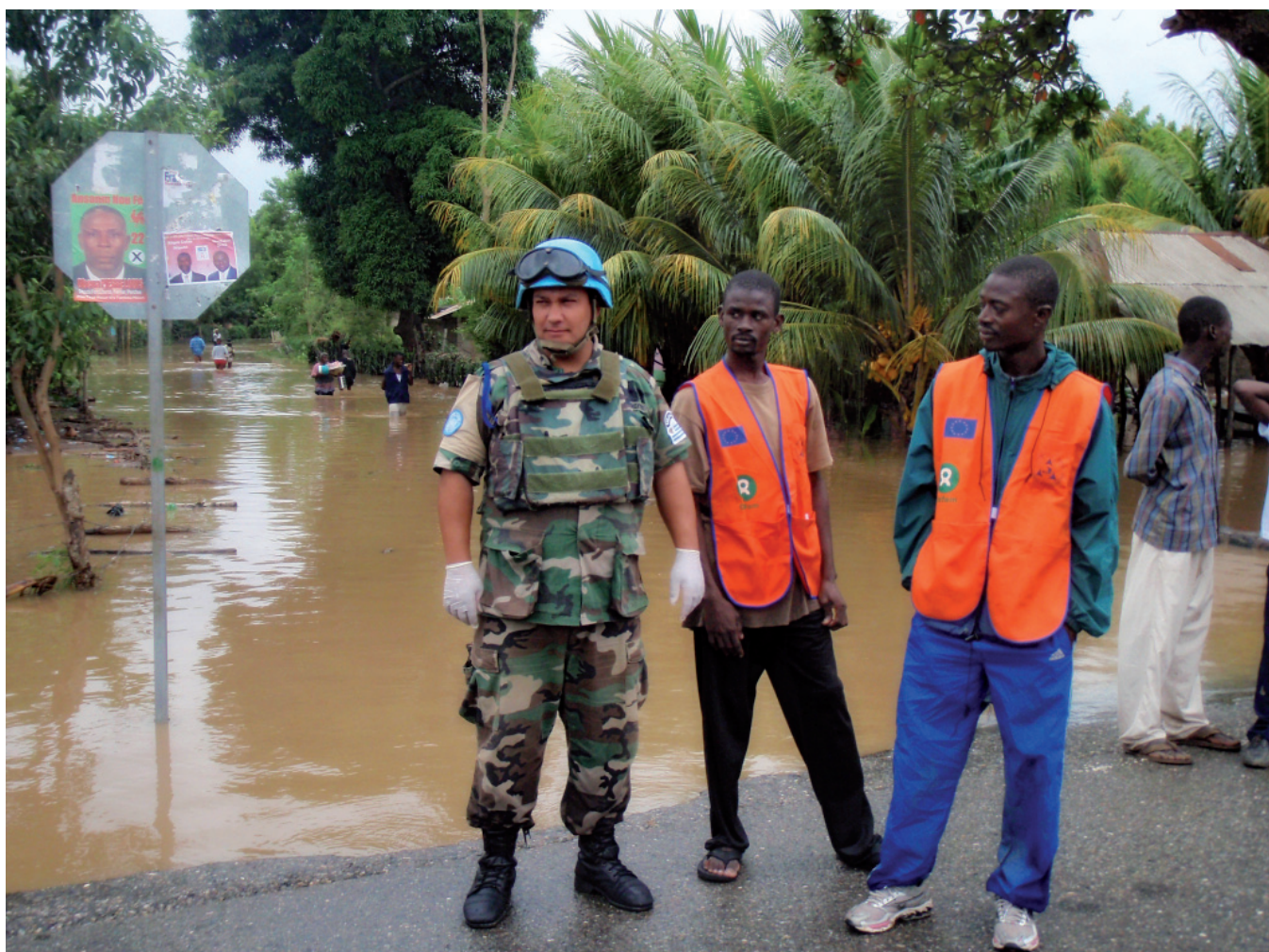
El manejo del idioma local (Creole) fue un elemento de gran importancia para establecer una comunicación efectiva con la población.

sin lugar a dudas que lo hacemos para ayudar porque nosotros nos ponemos en el lugar de cada uno de esos niños y pensamos que estos bien podrían ser los nuestros. El soldado se sonrió, me dio un fuerte abrazo y me dijo ‘sigan así ojalá todos pensáramos como Ustedes’.” A lo que agregó: “Asuntos Civiles es sin dudas AYUDAR con mayúsculas y es la parte más visible de nuestro Ejército, y siempre cada uno de nosotros sentimos más que nadie el orgullo de ser Uruguayo, asumiendo el compromiso y diciendo siempre al regresar a casa ‘Supimos Cumplir’”.