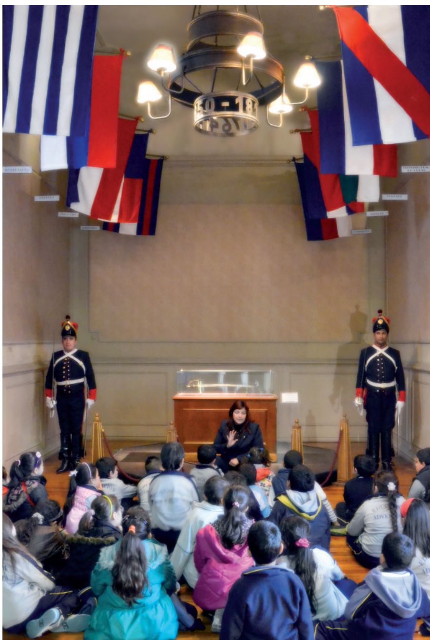
En el Salón de Honor se encuentra el sable que perteneciera al General Artigas, permanentemente custodiado y acompañado por las banderas de la Liga Federal.

De vuelta en la entrada, los escolares se preparan para retirarse. Se llevan con ellos valiosos conocimientos que adquirieron en este “viaje en el tiempo” hasta las raíces de la orientalidad y que de seguro serán de singular valor en su formación como ciudadanos. 🇺🇷