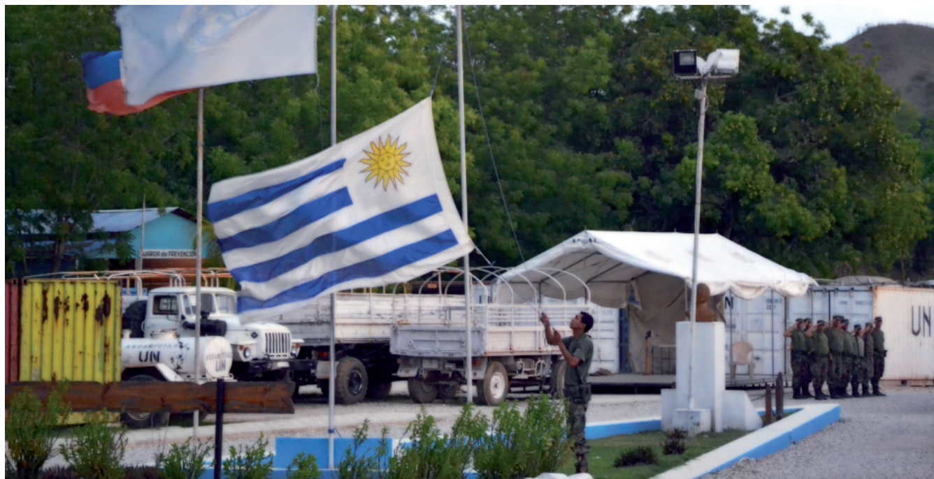
Arriado del Pabellón Nacional en la base “Teniente Coronel Gonzalo Martirené” ubicada en Mirebalais, República de Haití.

DE FESTEJO. Se cumplen 69 años del nacimiento de la Organización de las Naciones Unidas, actualmente compuesta por 193 Estados miembros.