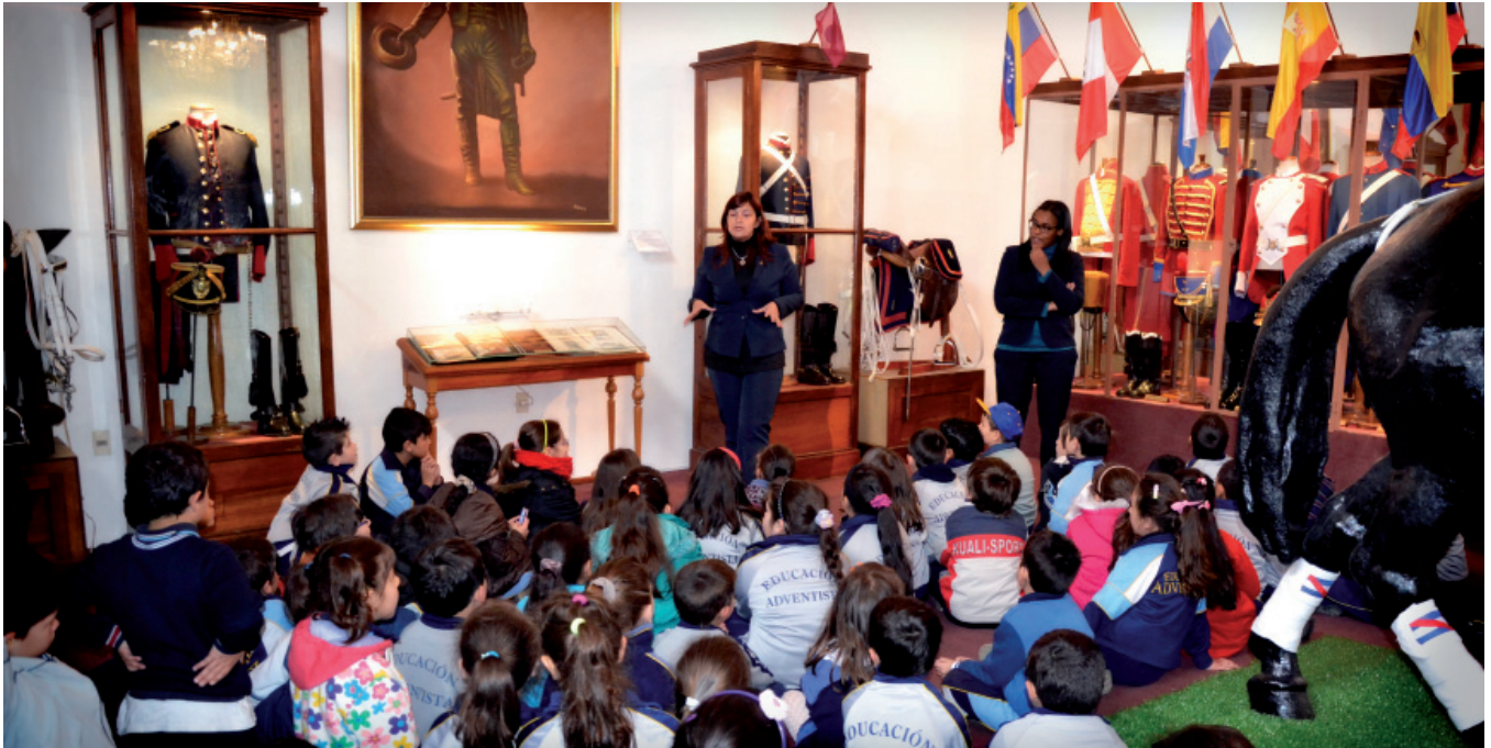
Alumnos del Colegio Adventista en la Sala de Uniformes: adaptar los contenidos a la edad de los escolares es clave.

VUELTA A LOS ORÍGENES. El museo que se encuentra en el interior del Regimiento “Blandengues de Artigas” de Caballería N° 1 atesora un valioso acervo histórico que conjuga con éxito lo que los orientales definimos como “identidad nacional”. La Fuerza de Todos se unió a una visita guiada junto a un grupo de escolares y vivió la experiencia de cerca.