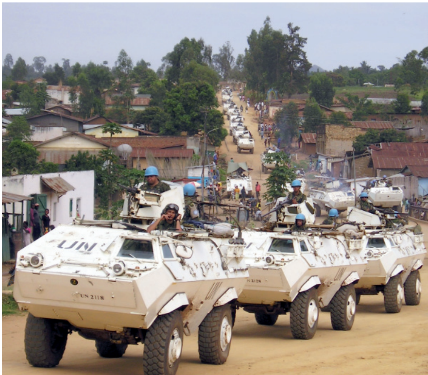
RDC: Un convoy de vehículos mecanizados conducidos por Cascos Azules uruguayos se abre paso por las calles de la ciudad de Bunia (2003).

En cuanto a la república africana, la colaboración del Ejército Nacional comenzó en 1999. El conflicto se suscitó debido a las guerras locales entre facciones revolucionarias que recibían el apoyo de países limítrofes. La misión de Uruguay y el resto de los países integrantes de la ONU consiste en garantizar el cese al fuego, el desarme y la retirada de las tropas de otros países, así como otorgar asistencia humanitaria. Actualmente cerca de 1.000 efectivos uruguayos prestan su servicio por esta causa.