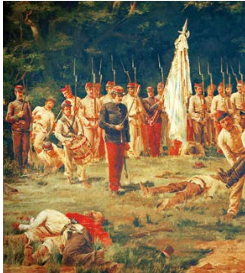
Obra del artista Juan Bautista Diógenes Hequet que se encuentra en custodia en

En el nuevo ataque de los paraguayos, una bala atraviesa por el costado derecho el cuerpo del Coronel de Palleja, quien se mantenía a caballo, que al recibir la bala mortífera, se inclinó al costado izquier-