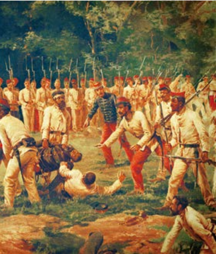
el Salón de Honor del Batallón "Florida" de Infantería N° 1 desde el año 1998.

TRINCHERA DEL BOQUERÓN DEL SAUCE POTRERO DEL SAUCE