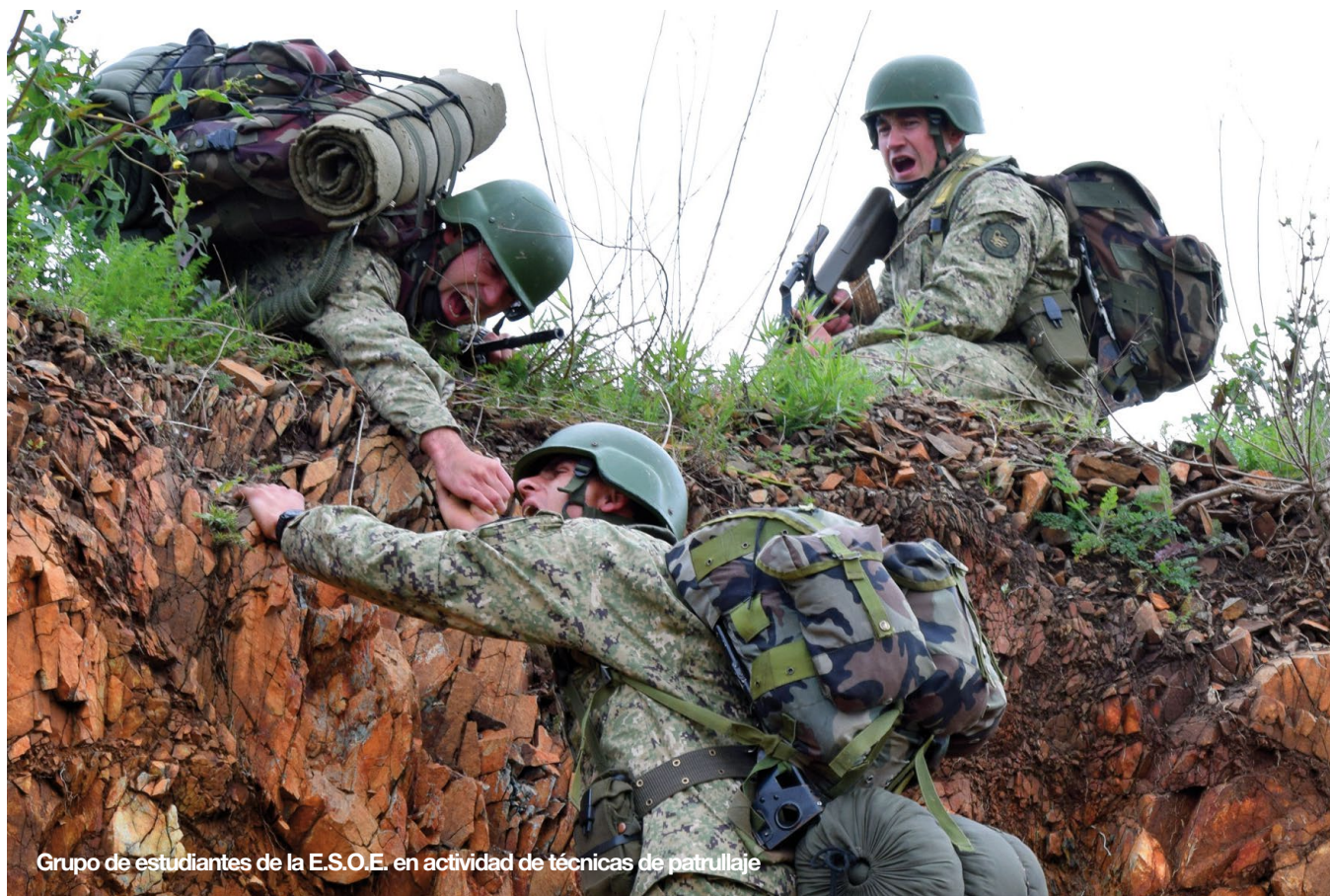
Grupo de estudiantes de la E.S.O.E. en actividad de técnicas de patrullaje

Todos son ejemplos destacables, desde los que se quedan en la tarde - noche repasando apuntes para el otro día hasta algún soldado que pidió para evacuar a su familia de una vivienda inundada en San José, y luego de solucionar la lamentable situación retomó el curso y se puso al día con la clase. Del primero al último y sin desmerecer a ninguno, insisto, son todos un ejemplo.