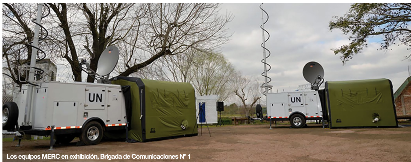
Los equipos MERC en exhibición, Brigada de Comunicaciones N° 1

Uno de estos equipos será traslado a la República Democrática del Congo “para apoyar la operación de paz que lleva adelante el contingente uruguayo en ese país”, según se expresó en un comunicado de la embajada de EE.UU. en este país.