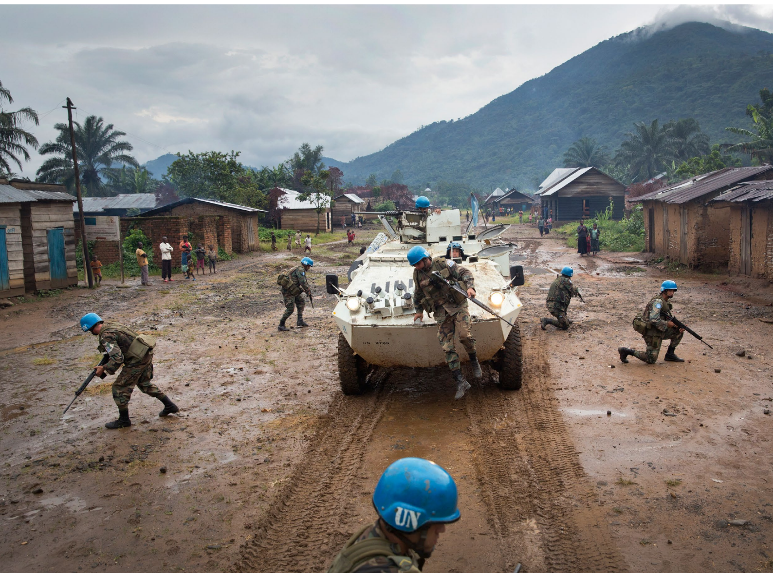
Soldados uruguayos patrullan la aldea de Pinga, el 4 diciembre de 2013.

Con el cambio de siglo, se desplegó un batallón en la República Democrática del Congo que ya lleva 17 años en el país, y en el año 2004 en la República de Haití.