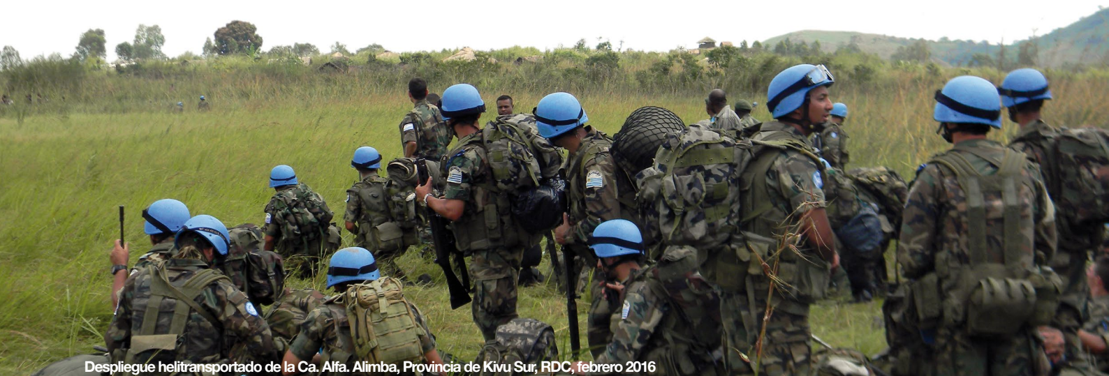
Despliegue helitransportado de la Ca. Alfa. Alimba, Provincia de Kivu Sur, RDC, febrero 2016

Ante la llegada de un nuevo proceso electoral en la República Democrática del Congo, el contingente nacional inició un proceso de redespliegue de sus bases con la finalidad de brindar un apoyo eficiente a las elecciones.