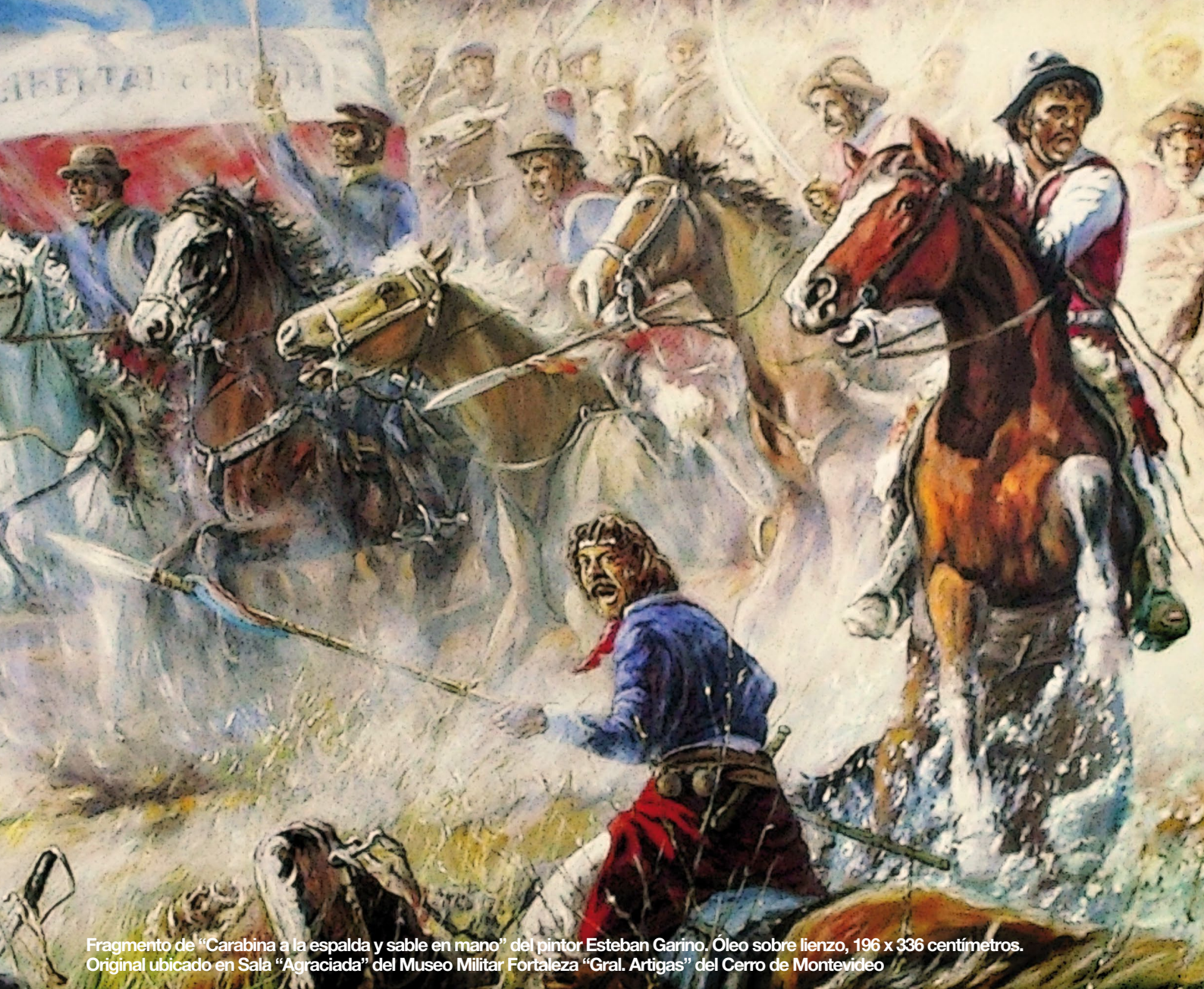
Fragmento de "Carabina a la espalda y sable en mano" del pintor Esteban Garino. Óleo sobre lienzo, 196 x 336 centímetros. Original ubicado en Sala "Agraciada" del Museo Militar Fortaleza "Gral. Artigas" del Cerro de Montevideo

volución antes que se sumaran otros actores a la lucha.