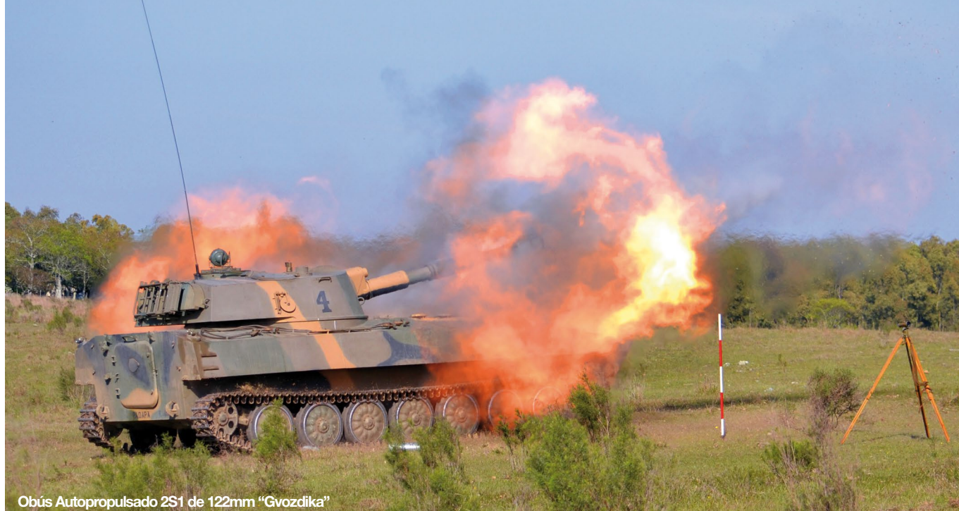
Obús Autopropulsado 2S1 de 122mm "Gvozдика"