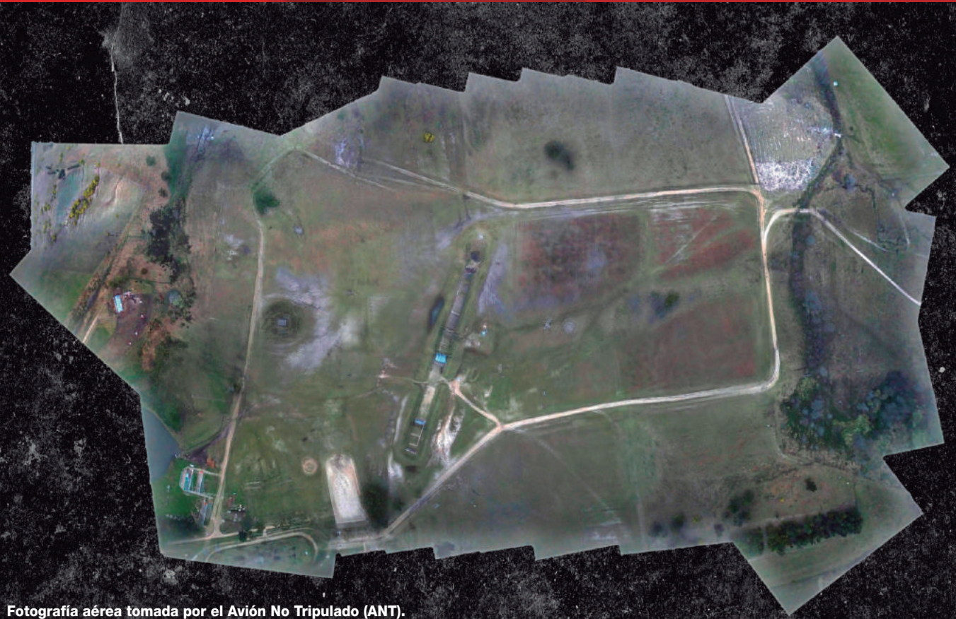
Fotografía aérea tomada por el Avión No Tripulado (ANT).