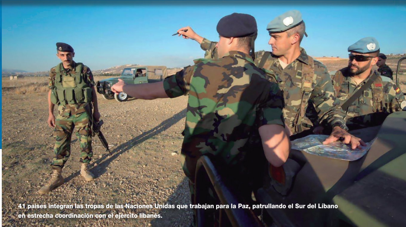
41 países integran las tropas de las Naciones Unidas que trabajan para la Paz, patrullando el Sur del Líbano en estrecha coordinación con el ejército libanés.

En un país que es herencia del Imperio Otomano y conviven una gran diversidad confesional, la presencia uruguaya es mediadora de la paz.